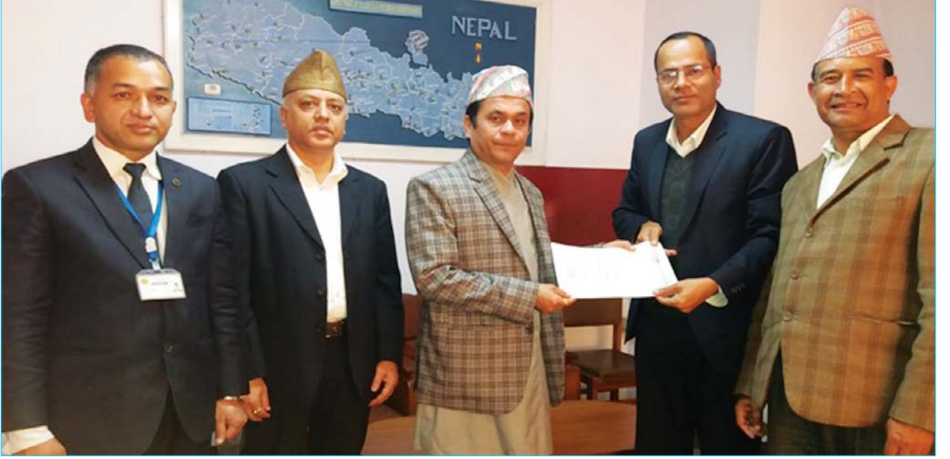
नेपाल धितोपत्र बोर्ड र नेपाल राष्ट्र बैंकबीच सूचना आदान प्रदान सम्झौता कार्यक्रमको एक भ्रमक

बोर्डले २०७४ कार्तिक २० मा बैंकिङ सूचना आदान प्रदान तथा पारस्परिक सहयोगसम्बन्धी नेपाल राष्ट्र बैंकसँग द्विपक्षीय समझदारी तथा सहयोग सम्झौता गरेको छ । धितोपत्र बजार नियमन निकायहरूको अन्तर्राष्ट्रिय संस्था आइएस्को (IOSCO) को सिद्धान्त तथा अन्तर्राष्ट्रिय अभ्यास बमोजिम आइएस्को (IOSCO) को एशोसिएट सदस्य भैसकेको बोर्डले साधारण सदस्यता प्राप्त गर्न धितोपत्र बजारमा हुने कारोबार तथा अन्य गतिविधि सम्बन्धी कसुरको खोज/अनुसन्धानका लागि बैंकिङ अभिलेखमा पहुँच हुनुपर्ने प्रावधान अनुसार वित्तीय प्रणालीका महत्वपूर्ण निकायका रूपमा रहेका बोर्ड र नेपाल राष्ट्र बैंक बीच उक्त समझदारी भएको छ । अर्थतन्त्रको दिगो विकासको लागि वित्तीय क्षेत्रका गतिविधिहरूलाई थप पारदर्शी एवं प्रतिस्पर्धी बनाई सर्वसाधारण लगानीकर्ताको हितको सुरक्षा सुनिश्चित गर्न वित्तीय क्षेत्रमा हुने गलत कार्यहरू बैंकिङ कसुर तथा धितोपत्रको भित्री कारोबार लगायत अन्य विविध कसुरका कारण धितोपत्र बजार लगायत