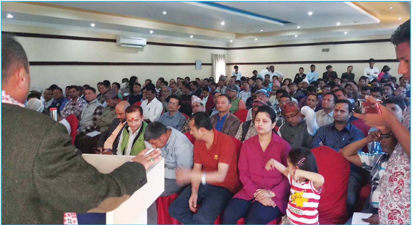
दाङमा आयोजित प्रशिक्षण कार्यक्रमको एक भलक

उक्त कार्यक्रममा सहभागीका तर्फबाट धितोपत्रको कारोवार प्रणाली पूर्णरूपमा स्वचालित बनाउनुपर्ने, सो क्षेत्रमा धितोपत्र दलाल व्यवसायीको शाखा कार्यालय छिटो भन्दा छिटो खुल्नुपर्ने, बैंकहरूलाई धितोपत्र दलाल व्यवसायीको अनुमति दिन ढिलाई गर्नुका कारणहरू आफुहरूले बुझ्न नसकेको, यस्ता कार्यक्रमहरू व्यापकरूपमा गर्नु पर्ने, दाङमा डिम्याट खाता खोल्न निकै समय लगाईदिने गरेकोले सो समस्याको निकास आफुहरूले पाउनुपर्ने, सि आर एन नं किन आवश्यक छ, नयाँ टक एक्सचेञ्जलाई अनुमति दिने प्रकृया कुन अवस्थामा छ, सूचना एवं जानकारी प्रवाह अभ्यासमा सुधार हुनुपर्ने जस्ता सुझाव तथा जिज्ञासाहरू राख्नुभएको थियो । कार्यक्रममा उठेका विषयहरूको सम्बन्धित प्रस्तुतकर्ताहरूले जवाफ दिई कार्यक्रम सम्पन्न भएको थियो ।