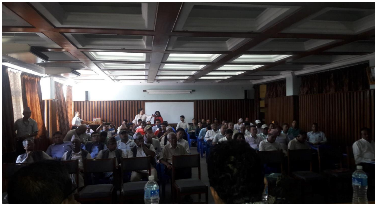
बोर्ड तथा पोखरा उद्योग वाणिज्य संघ द्वारा संयुक्तरूपमा आयोजित कार्यक्रममा उपस्थित लगानीकर्ताहरू ।

कार्यक्रममा बोर्डका अध्यक्ष डा. कार्कीले आर्थिक विकासका लागि आवश्यक हुने पूँजी बजारको महत्वपूर्ण भूमिका रहने हुँदा लगानीकर्ता सचेतना कार्यक्रममार्फत दुर्गम भनिएका जिल्लाहरूमा समेत यस्तो सचेतना कार्यक्रम संचालन गरिएको बताउनुभयो । त्यसैगरी आफ्नो क्षेत्रको विकासका लागि चाहिने पूँजी परिचालन गर्न स्थानीयस्तरको ऋणपत्र निकाल्न सकिने व्यवस्था गर्न लागिएको समेत भनाई राख्नुभयो ।